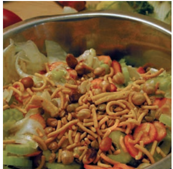
Gemüsesalat mit dem Bombay Mix bestreuen.

MIT FALAFFEL, LATKES, TABOULEH, BLINIS, BOMBAY MIX, ZHUG UND TAJINE GEWÜRMISCHUNG, FRISCHEN KRÄUTERN UND GEMÜSEN.