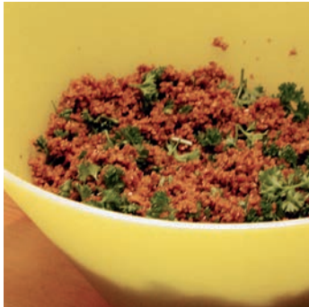
Tabouleh mit Petersilie oder Korianderkraut und einem Spritzer Zitrone verfeinern.